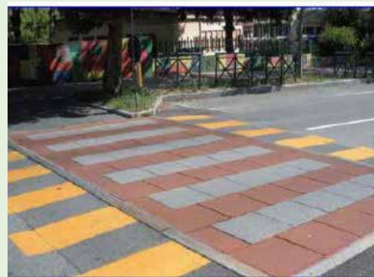
esempi di realizzazioni con sistema tipo "Pedibus"